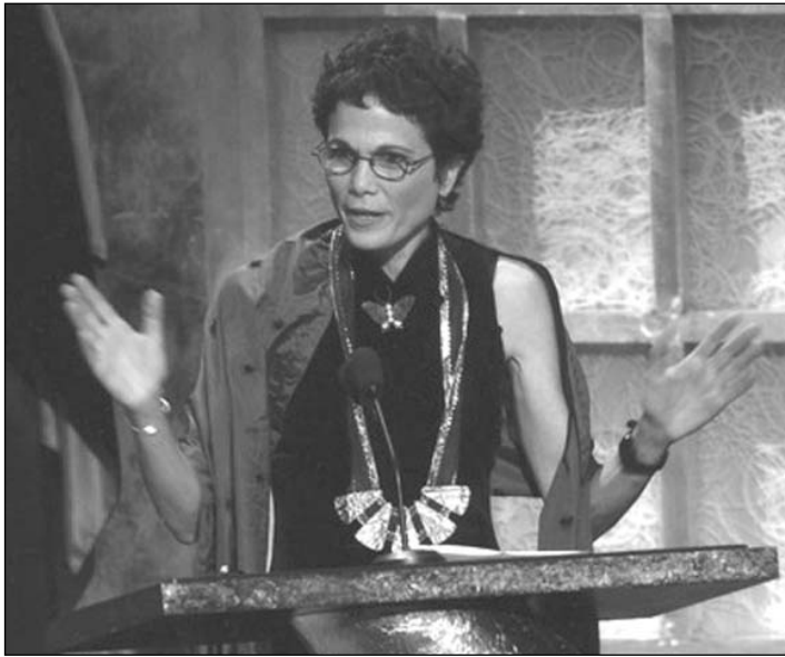
Consagrada escritora Julia Alvarez, nacida en NY y con raíces dominicanas, recibiendo en el 2002 el premio a la Herencia Hispana en Literatura.

Dedicada a Julia Alvarez (autora de "Había una vez una Quinceañera", "De cómo las muchachas García perdieron su acento" y "En el tiempo de las mariposas", llevada al cine y protagonizada por Marc Anthony y Salma Hayek).